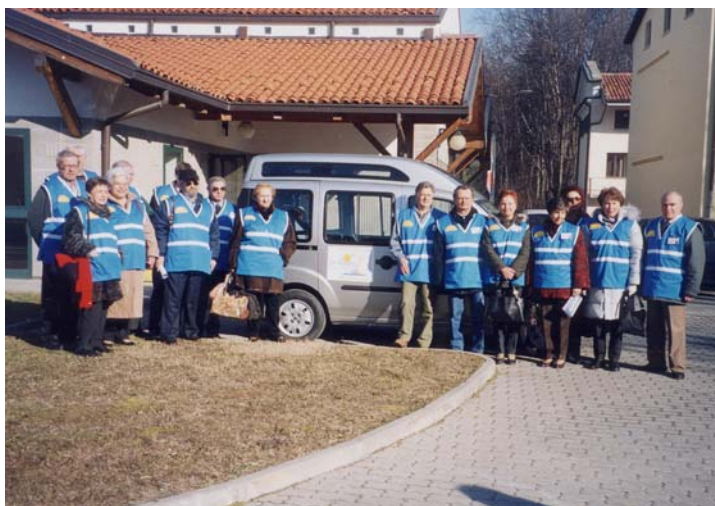
I volontari della "Zattera" con il Fiat Doblò.

La zattera è rappresentata da un nuovissimo Fiat Doblò grigio, attrezzato con pedana automatica per il trasporto di persone disabili e in carrozzella, che l'Amministrazione Comunale di Banchette ha messo a disposizione della nostra Associazione. L'automezzo, fondamentale per lo svolgimento della nostra attività, è stato recentemente acquistato con il contributo della Fondazione CRT.