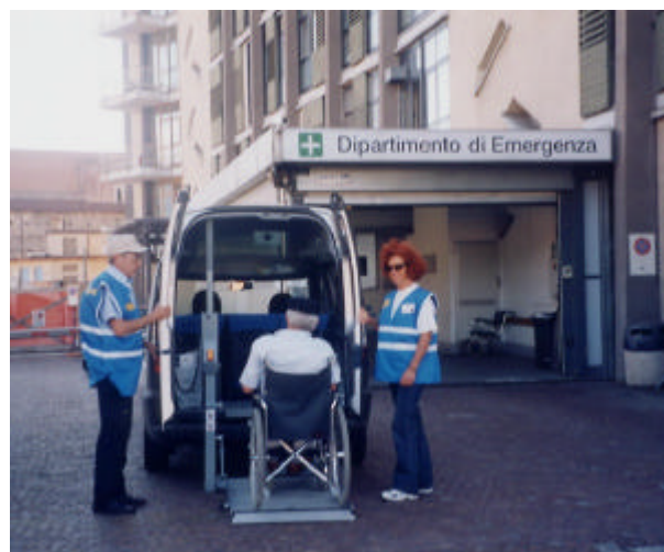
Due dei 27 volontari della Zattera mentre accompagnano una persona all'ospedale di Ivrea.

STAMPA: Tipolitografia l'Artigiana - Via Torino, 6 - Burolo (TO) Stampato nel mese di SETTEMBRE 2003 - Tiratura 2000 copie