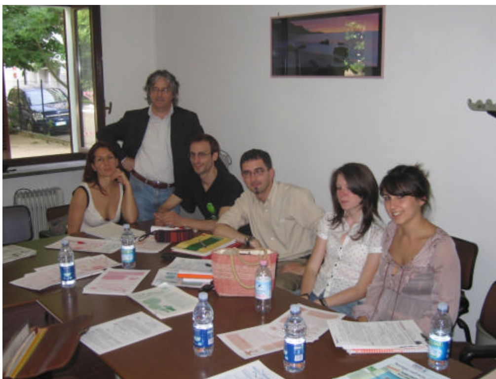
Gli studenti del corso di giornalismo insieme al Sindaco di Banchette.

Nella medesima occasione è passato in sede a salutarci il Sindaco di Banchette Maurizio Cieol.