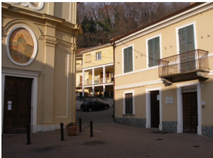
La sede di Samone della "Zattera" in Piazza della Chiesa.

Numero di cellulare : 340/0829213 attivo dal lunedì al venerdì dalle 12.00 alle 14.00.